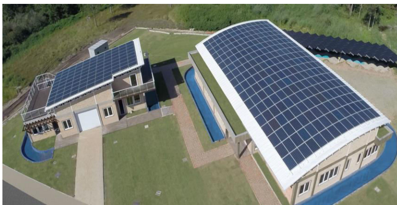
Figura 1- Centro de Pesquisa e Capacitação em Energia Solar da UFSC.

Um sistema FV pode ser considerado um elemento de destaque em uma edificação; pode estar integrado de forma sutil, sem que seja percebido; ou ainda pode comprometer negativamente todo o conjunto, quando estiver aplicado de forma inadequada. Sistemas FV integrados a edificações de forma harmônica e com bons resultados de desempenho energético são fundamentais para que haja maior aceitação e difusão de utilização desta tecnologia. Este trabalho busca aproximar arquitetos e engenheiros da tecnologia FV integrada a edificações inseridas em meio urbano através das diferentes aplicações demonstradas no Centro de Pesquisa e Capacitação em Energia Solar da Universidade Federal de Santa Catarina (UFSC) (Fig. 1), localizado no parque tecnológico Sapiens Parque, na cidade de Florianópolis (27.59° S, 48.54° O), um centro de pesquisa cujos objetivos incluem a disseminação de conhecimentos sobre a aplicação desta tecnologia no meio urbano. Portanto, esta edificação foi projetada para ser uma vitrine para a tecnologia FV, demonstrando diferentes formas de integração de módulos à arquitetura.