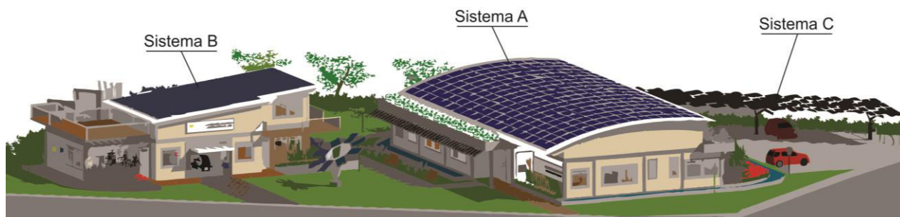
Figura 2- Localização e forma dos sistemas FV instalados no Centro de Pesquisa e Capacitação em Energia Solar.

O gerador FV do centro é composto por 3 sistemas: Sistema A, Sistema B e Sistema C. O Bloco A possui um sistema FV integrado à sua cobertura curva (Sistema A). O Bloco B possui um sistema FV integrado à sua cobertura inclinada (Sistema B). O estacionamento é coberto com módulos FV sendo utilizados como próprio material de vedação (Sistema C). A localização e forma dos subsistemas estão representadas na Fig. 2.