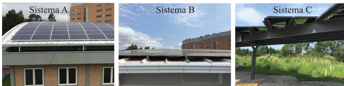
Figura 3- Detalhes construtivos dos Sistemas A, B e C.