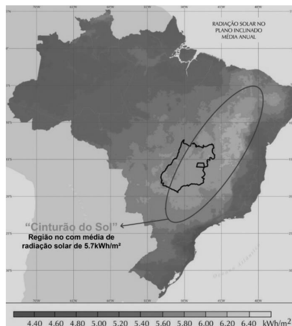
Figura 3: Média anual da radiação solar no plano inclinado.

O Atlas Solarimétrico do Brasil (2000) apresenta uma estimativa da radiação solar incidente no país, resultante da interpolação e extrapolação de dados obtidos em estações solarimétricas distribuídas em vários pontos do território nacional. Devido, porém, ao número relativamente reduzido de estações experimentais e às variações climáticas locais e regionais, o Atlas de Irradiação Solar no Brasil faz estimativas da radiação solar a partir de imagens de satélites.